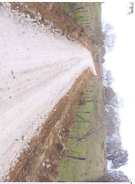
FOTO TERMINADA Y OPERANDO