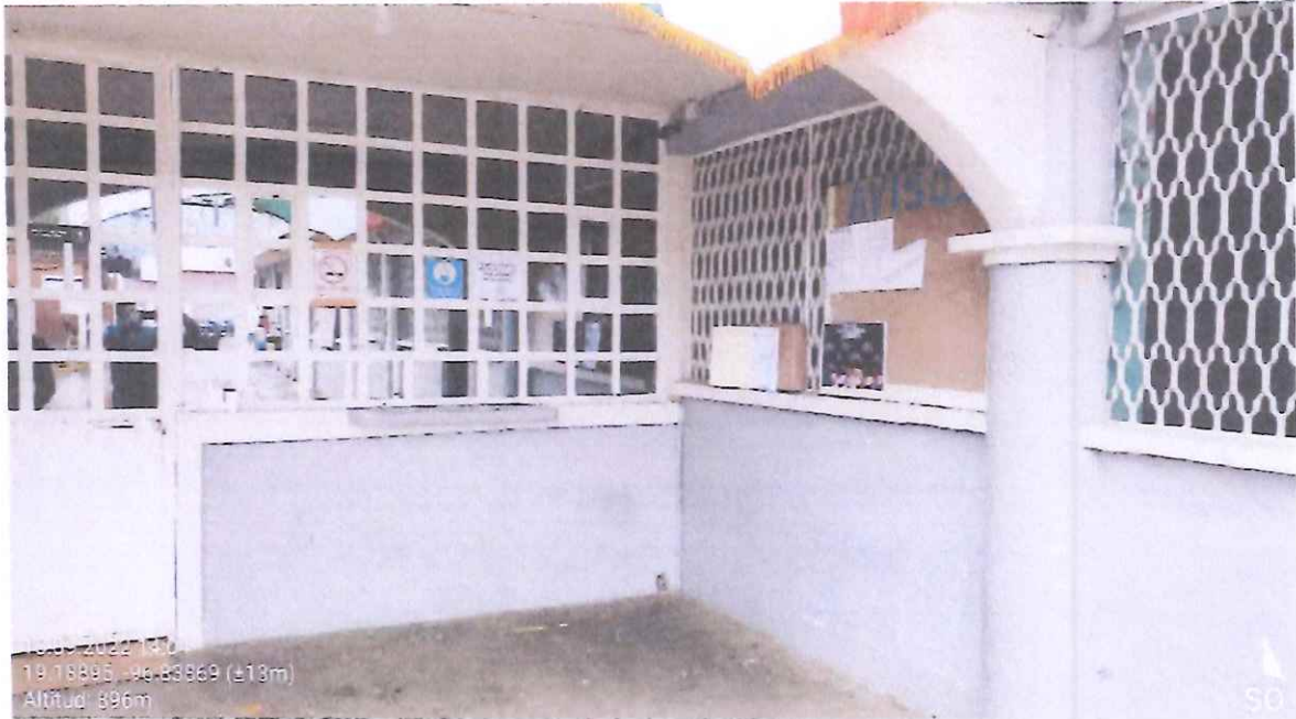
Tlacotepec de Mejía, Ver. 19 18886 - 99 83869 (+13m) Altitud: 896m

H. AYUNTAMIENTO CONSTITUCIONAL 2022 - 2025 SECRETARÍA TLACOTEPEC DE MEJÍA, VER.