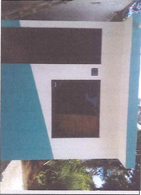
Concepto de obra ejecutado: FOTO TERMINADA Y OPERANDO

Municipio: TLACOTEPEC DE MEJÍA Localidad: TLACOTEPEC DE MEJÍA Ejercicio fiscal: EJERCICIO 2019 No. de obra: 2019301790005 Periodo: DICIEMBRE Número de estimación: 2 FINIQUITO Descripción: CONSTRUCCIÓN DE CUARTOS DORMITORIO EN ZAP 0045 Fuente de financiamiento: CIAL MUNICIPAL Y DE LAS Fecha de revisión: 31/12/2019