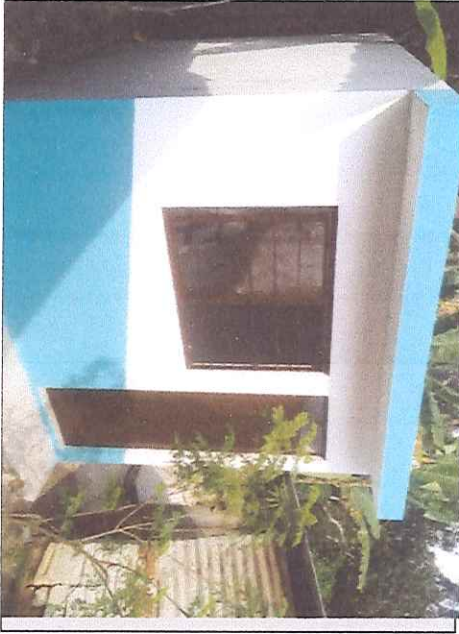
Concepto de obra ejecutado:

Municipio: TLACOTEPEC DE MEJÍA Localidad: TLACOTEPEC DE MEJÍA Ejercicio fiscal: EJERCICIO 2019 No. de obra: 2019301790006 Periodo: DICIEMBRE Número de estimación: 2 FINIQUITO Descripción: CONSTRUCCIÓN DE CUARTOS DORMITORIO EN ZAP 0030 Fuente de financiamiento: OCIAL MUNICIPAL Y DE LAS Fecha de revisión: 31/12/2019